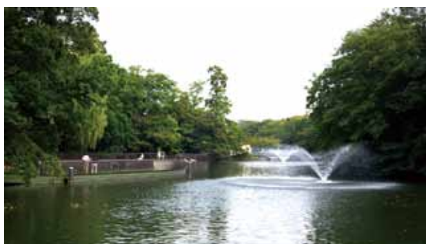
■井の頭公園 吉祥寺駅南口より徒歩5分。