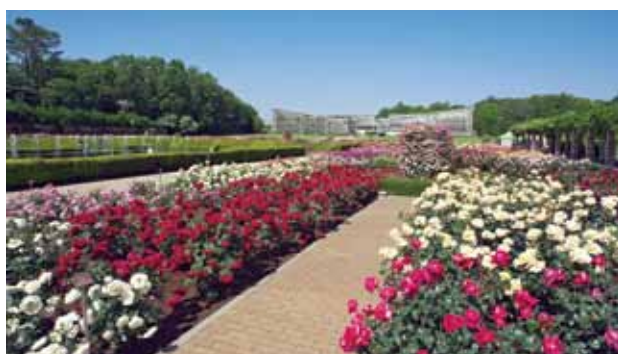
■神代植物公園 園内には4800種類、10万株の樹木。9月上旬はサルスベリ、パンパスグラスなどが見頃です。 隣接する深大寺参道は、深大寺そばが名物。