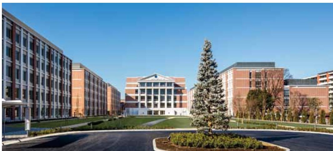
杏林大学井の頭キャンパス